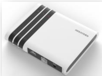
Hekatron Genius Port 259,00 €