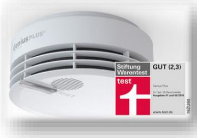
Hekatron Rauchwarnmelder Genius Plus 21,99 €