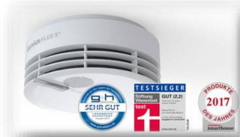
Hekatron Rauchwarnmelder Genius Plus X 40,96 €