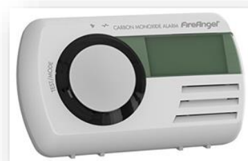
FireAngel CO-9D Kohlenmonoxidwarnmelder 41,99 €