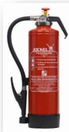
JOCKEL G 6 HDJ8 Gel FR Gel-Feuerlöscher 71,50 €