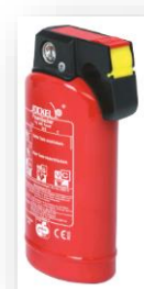
Jockel Feuerlöscher PS 1 JM PKW-Feuerlöscher 20,30 €