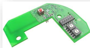
Hekatron Funkmodul Pro X 56,99 €